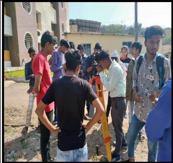
Theodolite Traverse Survey ,4 th Sem. Civil 21.01.2020