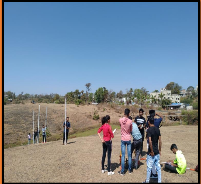
Tachometry Survey Project ,Saputara ,4 th Sem. Civil 27.02.2020