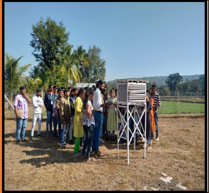
Weather Station Visit Agriculture college Farm, Waghai 4 th Sem. Civil 29.01.2020