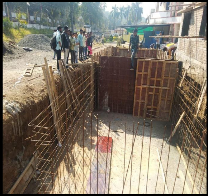
Under Ground Sump Construction Visit Visit Agriculture college Campus ,Waghai,4 th Sem. Civil 21.01.2020