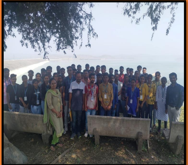
Ukai Dam & Hydro Power Station Visit ,Ukai ,6 th Sem. Civil 20.02.2020