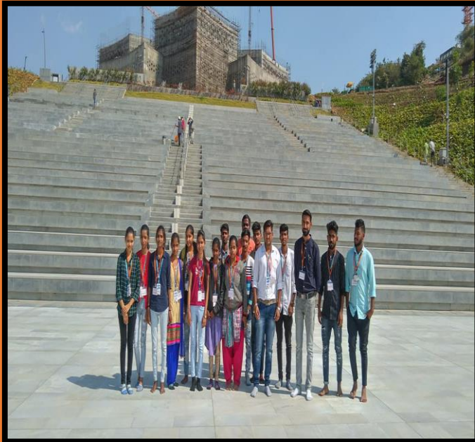
Ramchandra Mission Trust, Building Construction Visit ,Dharampur ,6 th Sem. Civil 05.02.2020